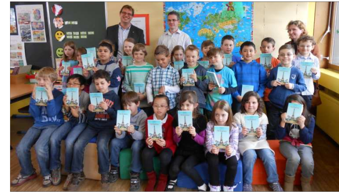
Bücherübergabe an die Hartmann-Baumann-Schule

Schulen: Finanzierung von Musikinstrumenten und der musikalischen Ausbildung in Schulen sowie Beschaffung von Lesebüchern für Grundschüler im Rahmen des Projekts „Lesen lernen – Leben lernen“.